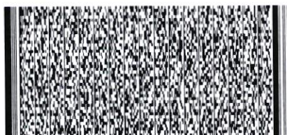
Timbre Electrónico SII

Referencias: 2322-162-SE24- Indicador Global Forma de Pago:Crédito